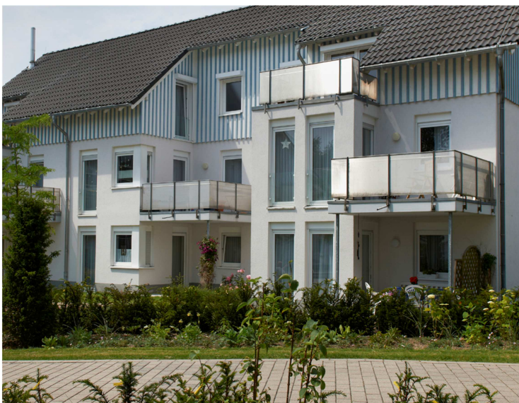
Foto: Eine aufgelockerte und abwechslungsreiche Fasadengestaltung schmückt den St. Theresien-Hof nicht nur von aussen.