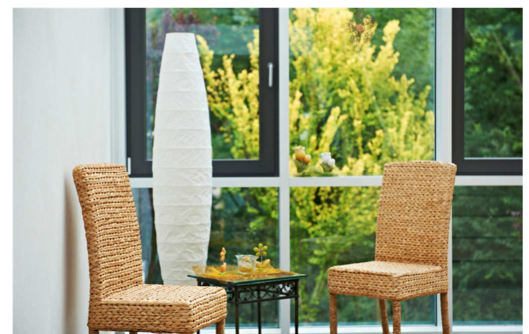
Foto: Flurbereich im Erdgeschoss