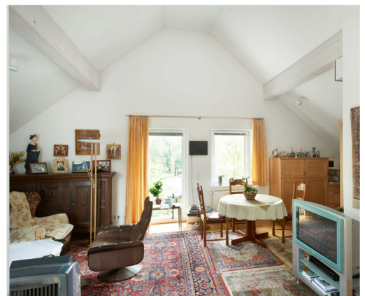
Foto: Innenaufnahme einer Dachgeschosswohnung